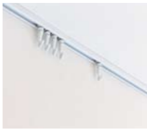
ピクチャーレール 工期1日 予算1万円~

絵画などを壁面に吊り下げて飾るために設置するレールのこと。洋服やカバン掛けなど壁面収納としての使用も可能。