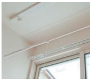
室内干し 工期1日 予算1万~16万円 (梁などによって変わります)

大がかりな工事を必要とせず、部屋の印象を変えることができるリフォームには他にこんなものがあります。