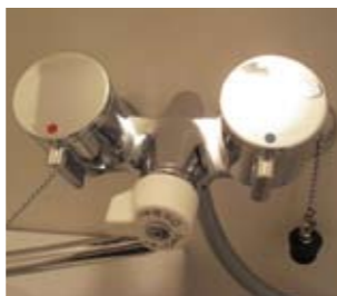
ハンドルキャップ 工期1日 予算1000円~

絵画などを壁面に吊り下げて飾るために設置するレールのこと。洋服やカバン掛けなど壁面収納としての使用も可能。