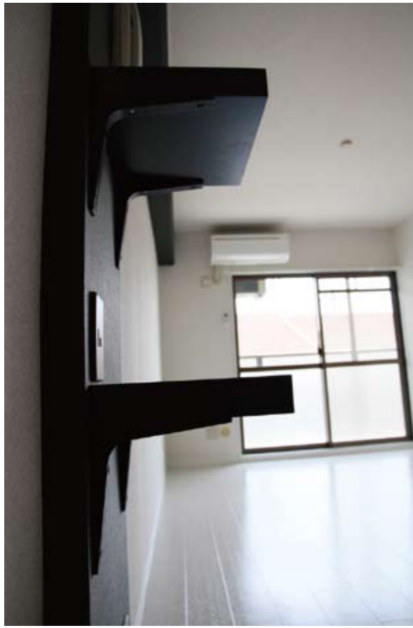
シンプルな飾り棚は使い方が制限されず、家具とのコーディネートも容易。取り付けるだけで無機質な空間に遊び心が加わります