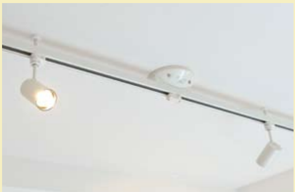
天井にダクトレールを取り付け、可動式のスポットライトを3~4灯設置

デザインリフォームはセンスが物を言う部分であるだけに、経験豊富なプロとタッグを組むことが重要です。特にオススメなのが、照明によるこだわりの空間演出。天井にダクトレールを取り付け、可動式のスポットライトを3~4灯設置する方法です。壁に当てて、間接照明として使用すると、まるで高級ホテルのような雰囲気に。インテリアの配置に合わせて、入居者が自由にライトを動かせるのもメリット。よりこだわりのある部屋づくりを実現することができます。当社では入居者ニーズや家主さまのご予算により最適なデザインリフォームを提案させていただきます。お気軽にご相談ください。