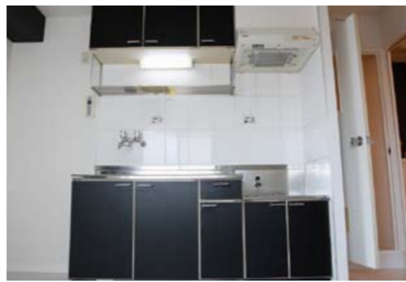
キッチンシートを施すことで、新品のように再生! 使用するにつれ、汚れが目立つ場所なので、このような濃い色もおすすです。目を引く配色が部屋のアクセントにもなっています